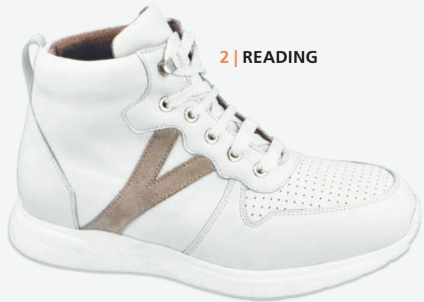
2 | READING