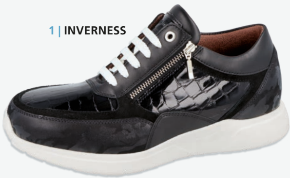
1 | INVERNESS