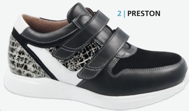
2 | PRESTON