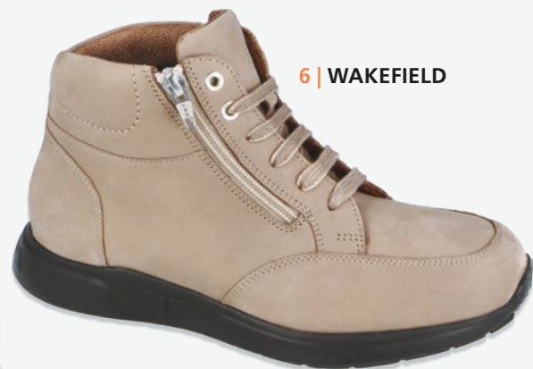
6 | WAKEFIELD