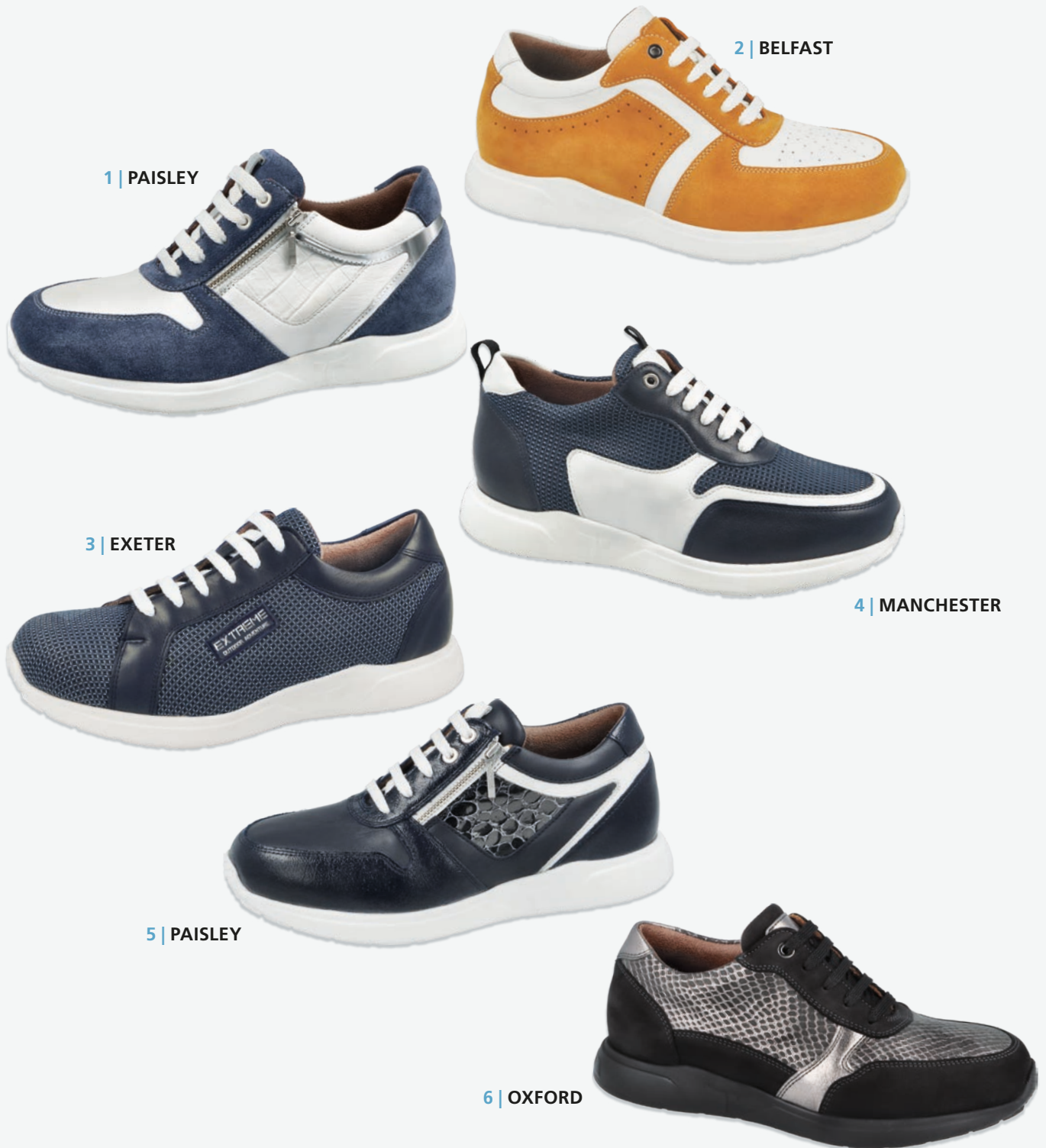
1 | PAISLEY