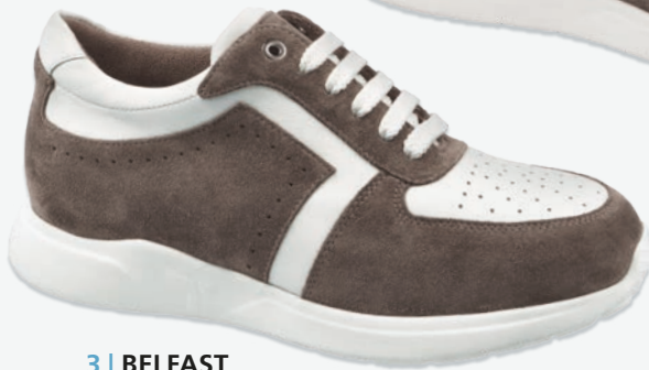
3 | BELFAST