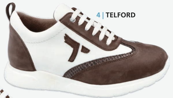
4 | TELFORD