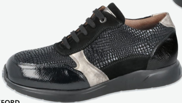
3 | OXFORD