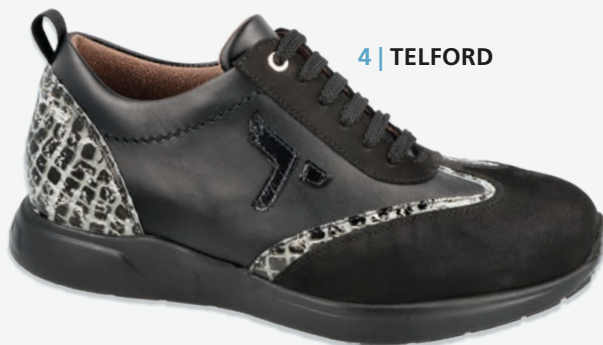
4 | TELFORD