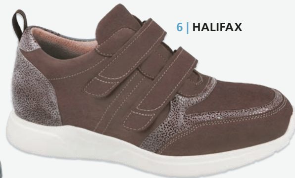
6 | HALIFAX

1 | PRESTON 925 4.5137 | Weite W | Gr. 36-42 schwarz/schwarz/midnight/schwarz Nappa/Reptil-Lack/Brillino/Nubuk Laschen- und Abschlusspolster Sohle: Passion schwarz