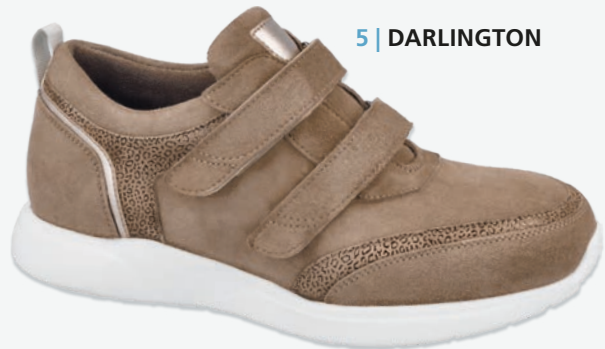
5 | DARLINGTON