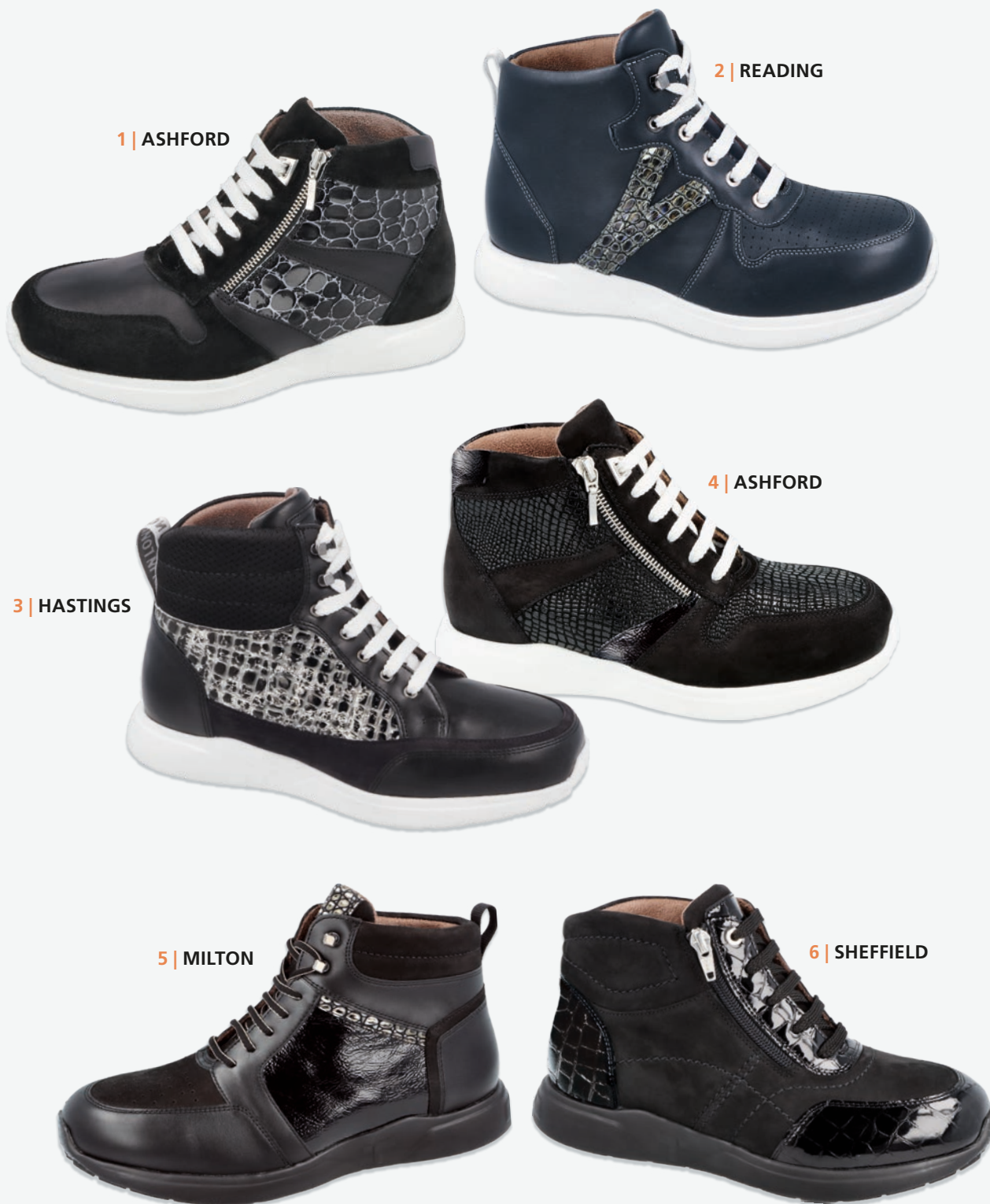
1 | ASHFORD