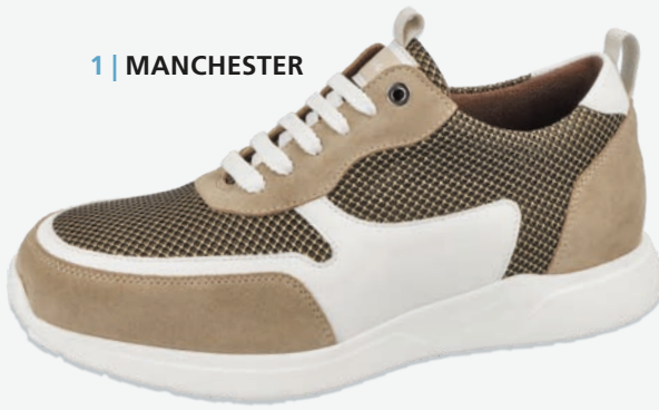
1 | MANCHESTER