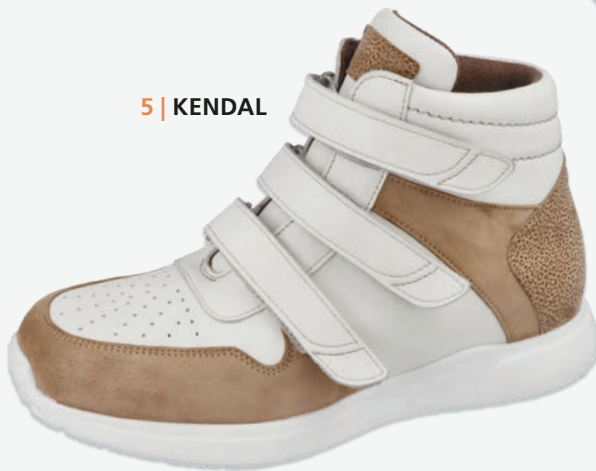
5 | KENDAL