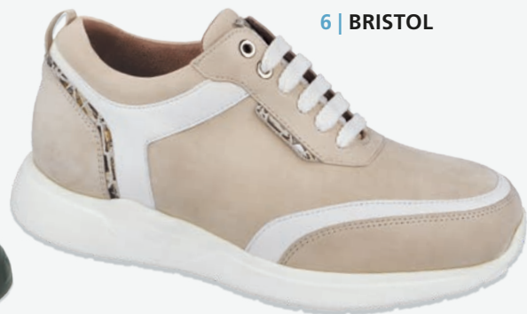
6 | BRISTOL