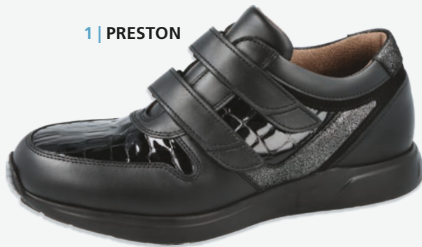
1 | PRESTON