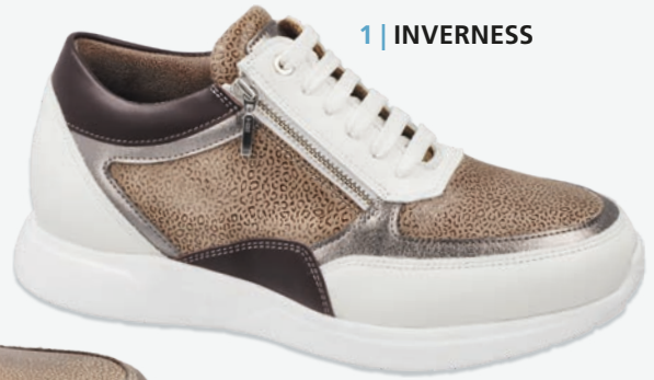
1 | INVERNESS