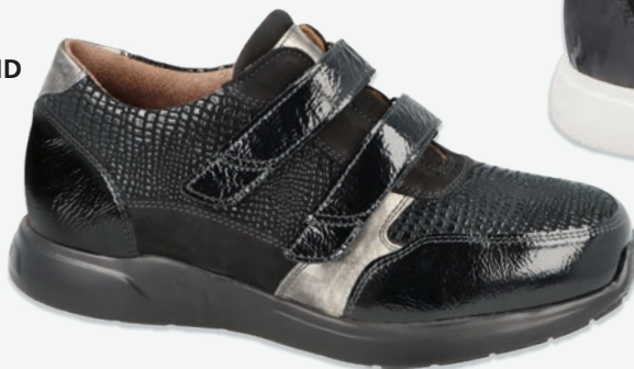
3 | SUNDERLAND