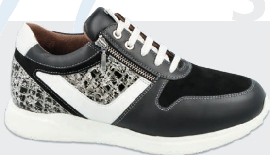
Halbschuhe mit Schnürung • Seite 3 - 8