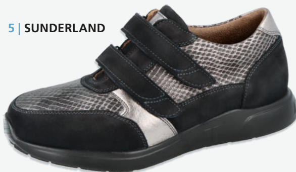
5 | SUNDERLAND