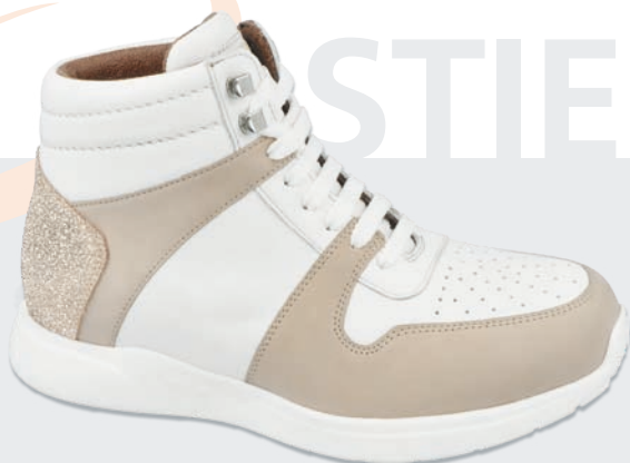
Stiefel mit Schnürung • Seite 12 - 15