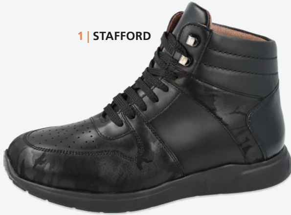
1 | STAFFORD