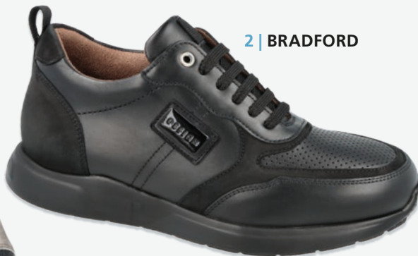
2 | BRADFORD