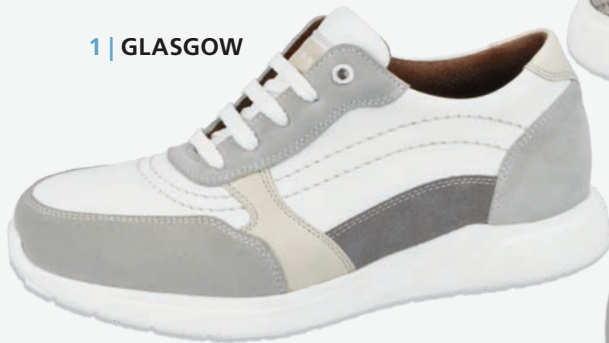
1 | GLASGOW