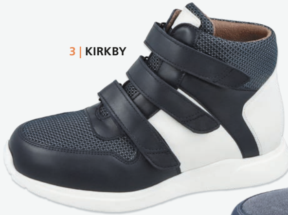
3 | KIRKBY