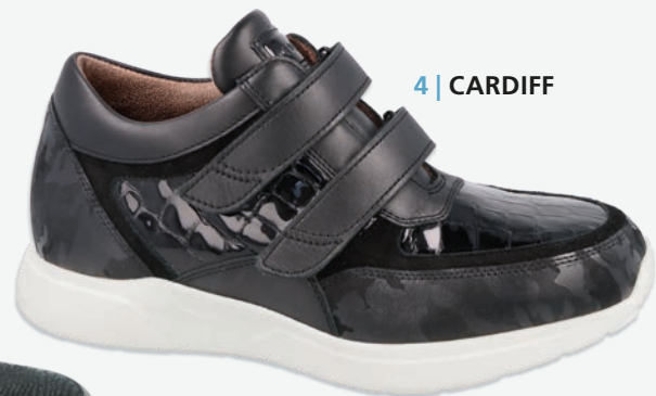
4 | CARDIFF