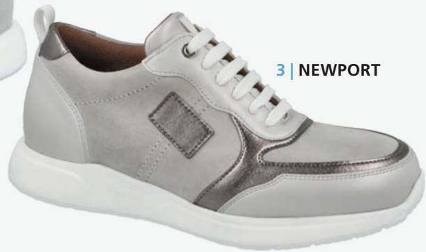
3 | NEWPORT