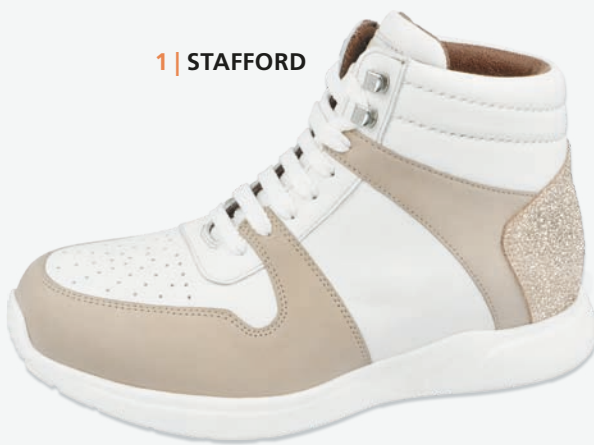
1 | STAFFORD