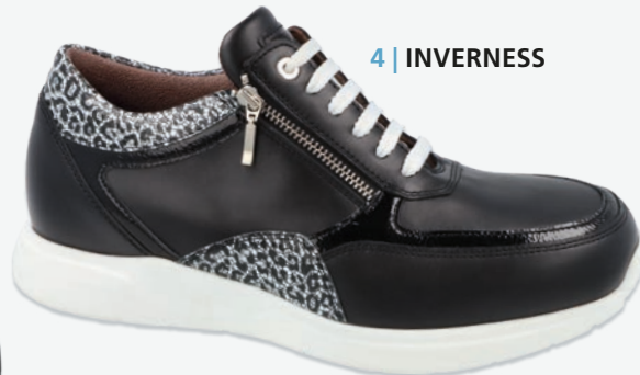
4 | INVERNESS