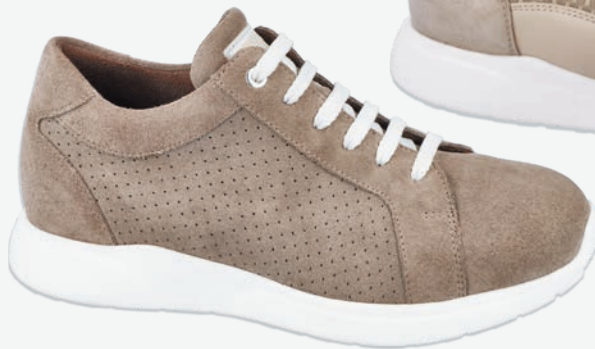
4 | LANCASTER