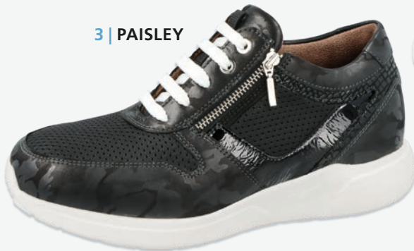
3 | PAISLEY