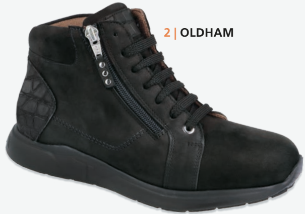
2 | OLDHAM