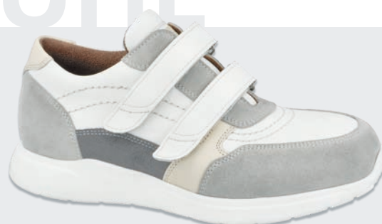
Halbschuhe mit Klettverschluss • Seite 9 - 10