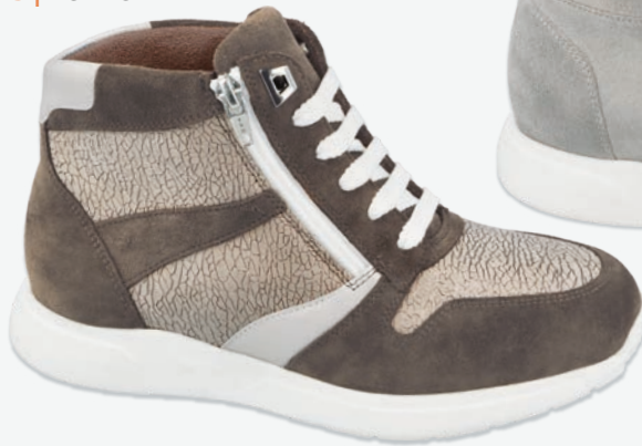
3 | ASHFORD