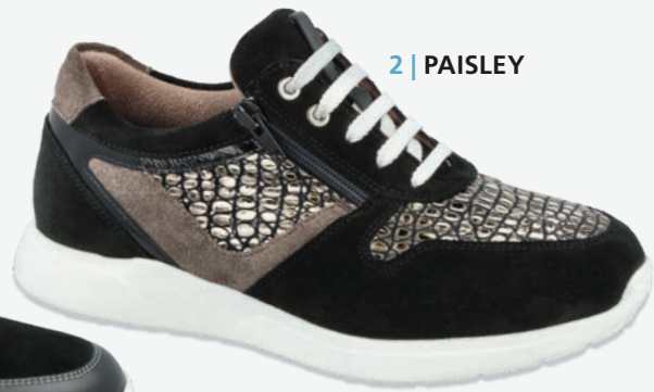
2 | PAISLEY