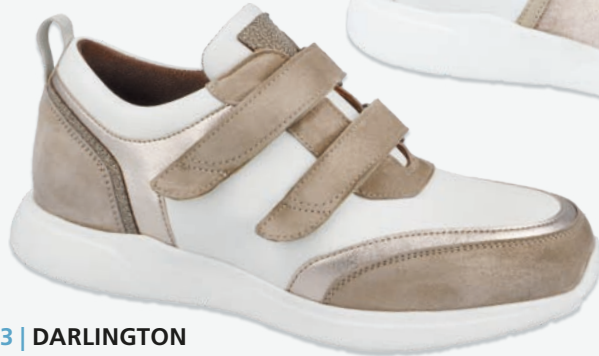
3 | DARLINGTON