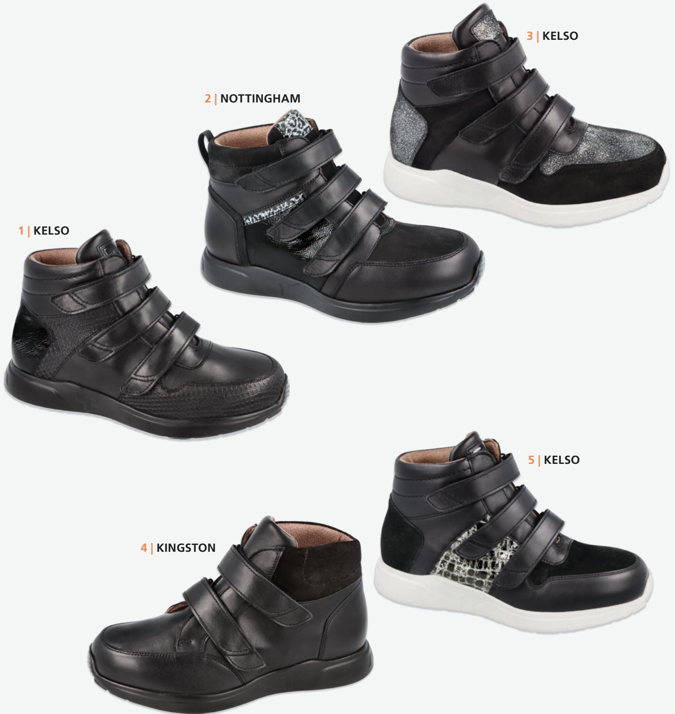
1 | KELSO