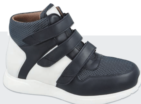
Stiefel mit Klettverschluss • Seite 15 - 16

Technischer Aufbau und Informationen • Seite 17