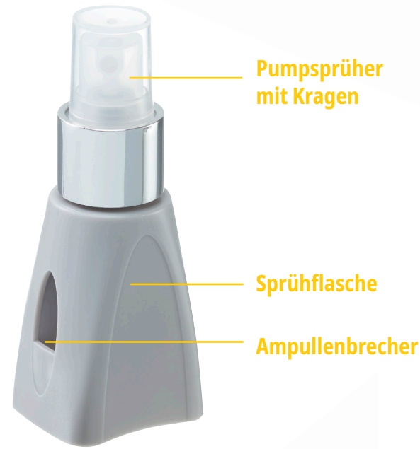
Pumpsprüher mit Kragen

Der praktische Begleiter mit integriertem Ampullenbrecher ist vielseitig einsetzbar und für die unterschiedlichsten Flüssigkeiten perfekt geeignet.