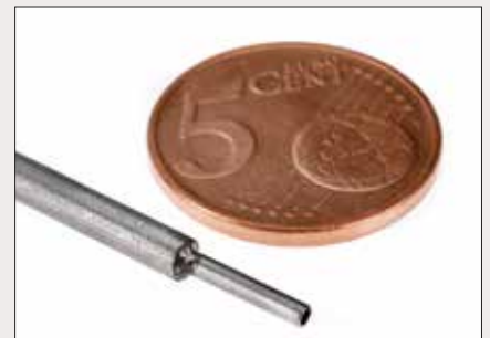
Dichtschweißen von Druckleitungen