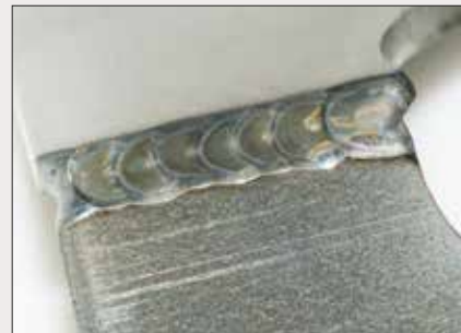
Schweißverbindung unterschiedlicher Metalle