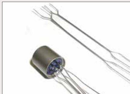
Feinschweißungen an elektronischen Bauteilen wie z. B. an Thermoelementen