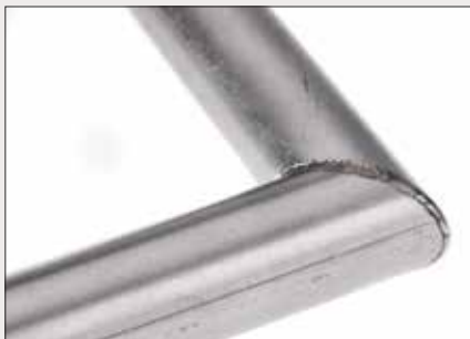
Schweißnaht an Rohr-Eckverbindung