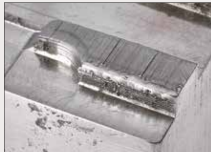
Auftragsschweißungen von Kanten