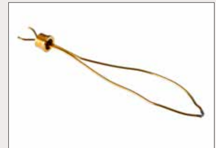
Herstellung von Temperatursensoren (Abb. zeigt Sensor aus Platin vergoldet)