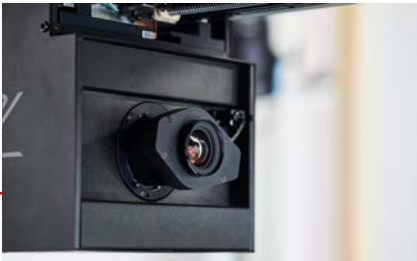
Kamerasystem mit Zeilen-sensor auf CMOS-Basis