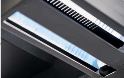
LED-Beleuchtungssystem für reflex- und schattenfreie Ergebnisse