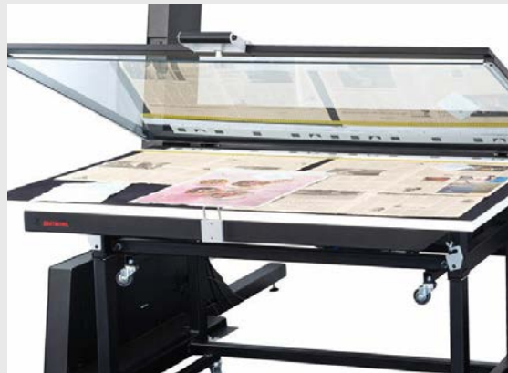
Auflichttisch AT 0 mit geöffneter Glasplatte