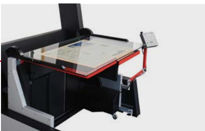
Umfangreiches Sortiment an wechselbaren Aufnahmesystemen für unterschiedlichste Formate