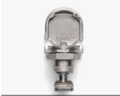
7-071 Kompressions-Drehriegel mit Klappe Edelstahl

Mit eingespritzter, unverlierbarer Dichtung. Werkzeuglos vormontierbar.