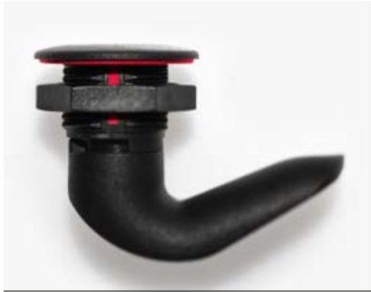
1-092 Drehriegel 2K-Polyamid

Drehriegel lassen sich als Verschlussmechanismus für zahlreiche Anwendungen einsetzen. Von vibrations sicheren Kompressions-Drehriegeln bis zu Drehriegeln mit einer Verschlussstellungsanzeige bieten wir höchste Variantenvielfalt an. Für besondere Anforderungen stehen auch spezielle Dichtungen, Erdungsfedern sowie andere Elemente und Materialien zur Verfügung.