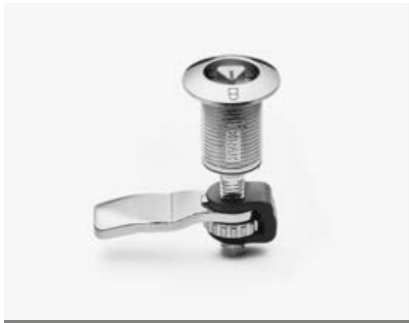
1-079 Kompressions-Drehriegel mit H-Maß Justierung

Die Klappe schließt nur im verriegelten Zustand und zeigt so die Verschlussstellung. Kompression 6 mm, vibrations- und rüttelsicher. Edelstahl.