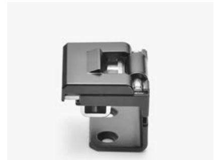
4-155 Scharnier für Einzelschrank

Einfache federunterstützte Demontage und Montage von Türen. Auch als Arretierstift verwendbar. Stiftdurchmesser 6 oder 8 mm, bis zu 4 mm Materialstärke einsetzbar.