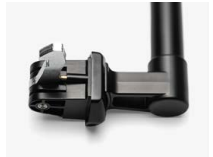
6-1680 Maschinengriff für Schiebetüren

Senkrecht und waagrecht verwendbar. Schmutzunempfindlich und korrosionsbeständig, funktionales Design.