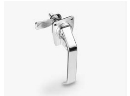
7-073.01 L-Griff für Vorhangs Schloss

Werkzeuglose Montage. Präziser Sitz durch Einklipsen.