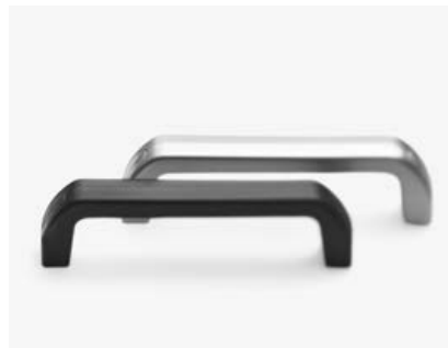
6-1000.01 Bügelgriff PA

Exakte Höhenverstellung der Zunge durch die neue Vierkant-Gewindestange. Edelstahl.