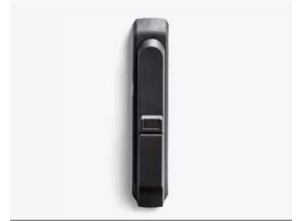
3-400 Schwenkhebel base

Schwenkhebel bieten im Vergleich zum einfachen Drehriegel ein höheres Drehmoment. Mit derartigen Verschlüssen lässt sich z. B. die Zutrittskontrolle zu Serverschränken professionell regeln. Darüber hinaus bieten wir auch Ausführungen mit sicherheitstesteten Varianten an.