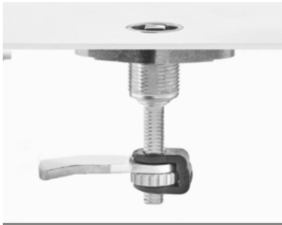
7-086 / 7-087 / 7-087.01 Flächenbündiger Kompressions-Drehriegel

Flache Kopfform. Markierung auf Gehäussekopf. Rüttel- und vibrations sicher nach DIN EN 61373. Mit Kompression 6 mm.