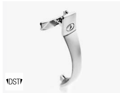
6-1110DST Bogengriff mit Drehriegel

Unser Sortiment an Griffen haben wir für eine große Zahl von Einsatzmöglichkeiten optimiert. Viele Griffen lassen sich auf Wunsch werkzeuglos montieren (DIRAK-SNAP-Technology) und sind in Zinkdruckguss, Polyamid oder Edelstahl erhältlich.